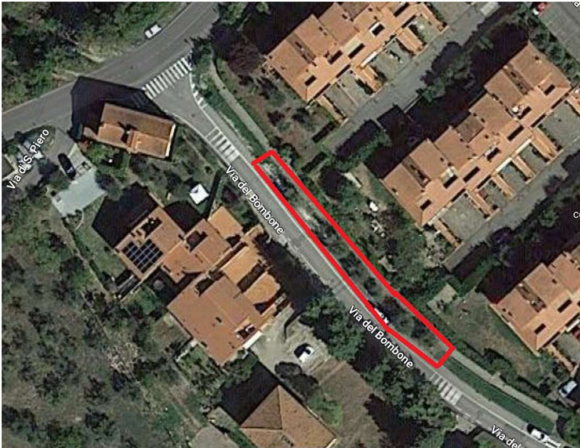
Lotto 3 Bombone via del Bombone tra S.P. del Bombone e via Nenni