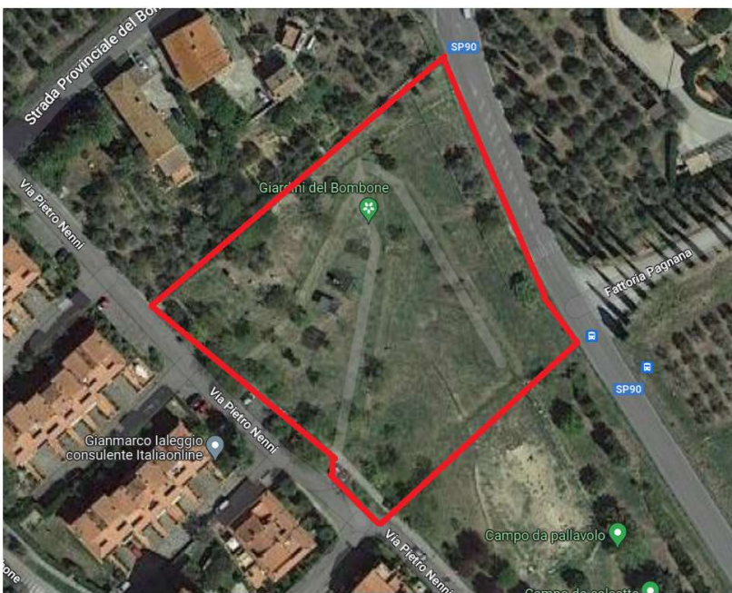
Lotto 5 Bombone Giardino via Pietro Nenni