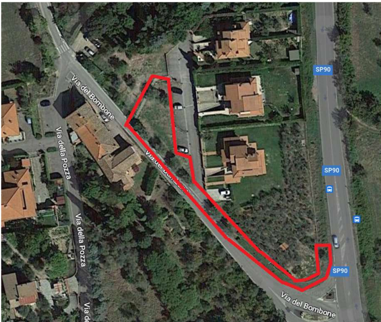
Lotto 4 Bombone - via del Bombone tra via della Pozza e SP 90