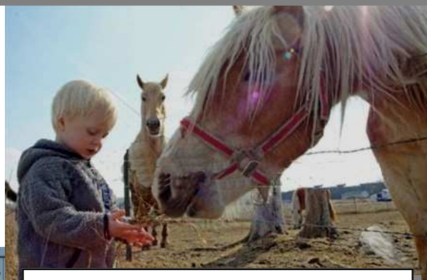
AVVICINAMENTO AL CAVALLO